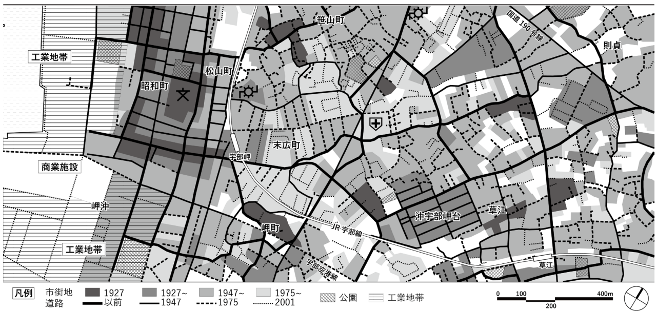
図3 対象区域の市街化の変遷

年時点で確認された笹山町、草江町、岬町の集落は周辺の開発に合わせて高密度が進むが、特に笹山町の集落は、1960年頃から農地の転換が活発に行われ、宅地が拡張していった。こうして形成された街路は、ほとんどが地形に合わせた複雑な形状である。戦後もなく、戦災者の住宅難に対応するべく、沖宇部岬台地区と末広町で住宅供給を行った。草江町の台地上に広範囲にわたって存在していた水田は、1970年代から開発が盛んに行われた。道路に沿って小規模な宅地開発が疎らに行われたため、虫食い状に宅地が形成された。通り抜けできない街路が多く、現在でも農地などの未開発地が残ったままである。