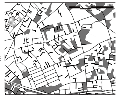
図5 草江町の袋小路と未開発地

ある(図5)。一方、谷地は水路と水田の区画が道路に転用されたこともあり、台地と比較すると整形な街区が形成されている部分も多い。なお、谷地は既成市街地に近い部分も開発時期が遅い。これは、整形の比較的規模の大きな水田であったため農業が優先されたことと、水はけが悪く宅地に不向きな土地であったことが理由として推察される。なお、臨海部に位置する規模の大きな炭鉱住宅や炭鉱の跡地は、宇部炭鉱の閉山を経て1970年代以降に市営住宅や商業施設、工場用地に転用されている。