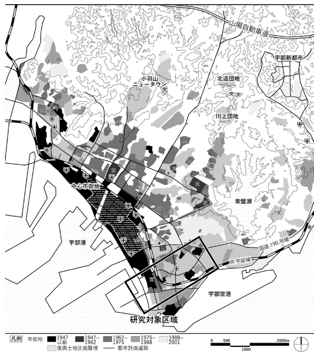
図1 宇部市の市街化(1947~2001)